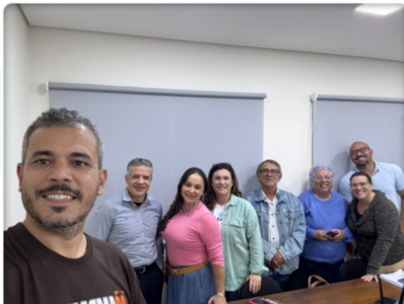
10 DE JUNHO | REUNIÃO CÂMARA TÉCNICA CAMINHOS DA FÉ A Câmara Técnica Caminhos da Fé realizou reunião no dia 10/06 para alinhamento das ações do projeto, incluindo as visitas às comunidades, com o apoio do Múltiplo Mulher.